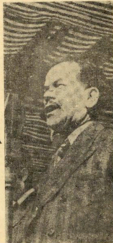
PRESIDENTE AGUIRRE CERDA