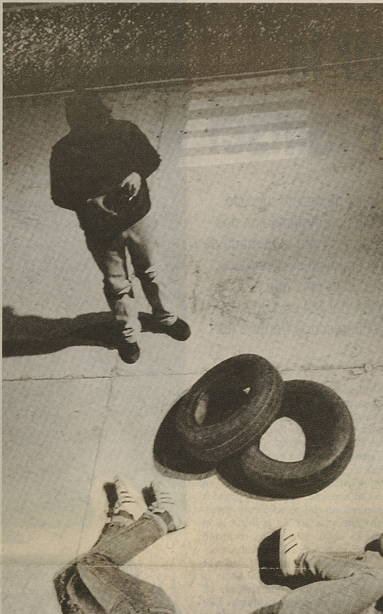
Es la primera vez que el teatro recoge el crimen contra Carmen Gloria Quintana y Rodrigo Rojas Denegri. La obra, es fruto de tres años de investigación en revistas no oficiales como "Análisis".

que aborda desde los diferentes actores involucrados en el caso: medios de comunicación; poder judicial; autoridad político militar; más las visiones de los implicados y los testigos. "Nos interesa ver cómo esas tramas operan sobre la realidad para construir las múltiples y contrastantes verdades dadas y asumidas en su momento. Se evidencia el resultado con la explosión de la realidad para que luego