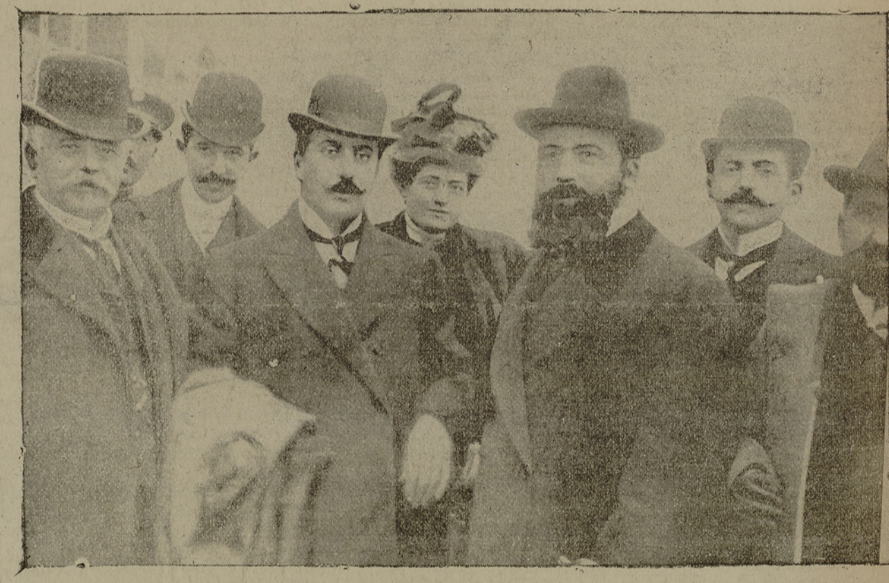
Giacomo Puccini Puccini y su esposa a bordo del "Savoia" en el puerto de Buenos Aires y algunos miembros de la comisión de recepción. Como se sabe, el célebre compositor de música, Giacomo Puccini está en la República Argentina, a donde ha venido a estrenar su nueva ópera Edgar . Mientras tanto ha recorrido la ciudad y visitado algunas capitales de provincias y granjas modelos, recibiendo en todas partes entusiastas acogidas.