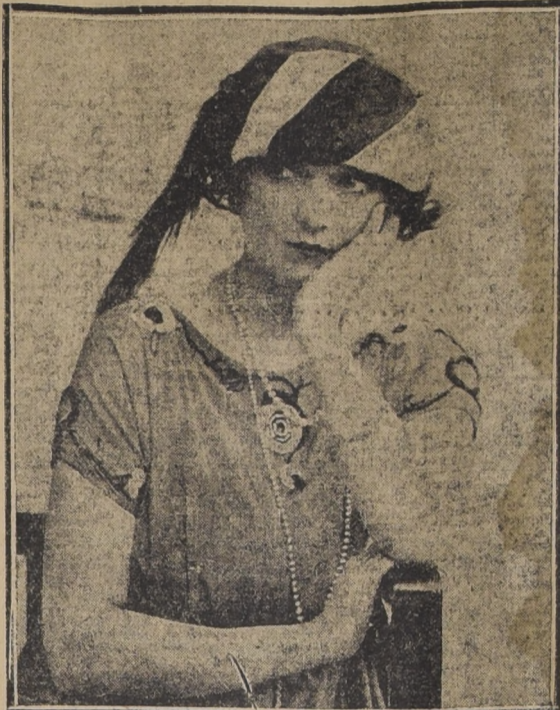
EN EL OXFORD, DE LONDRES, SE HA ESTRENADO LA COMEDIA MUSICAL "MAGGIE", CON MISS BARNES COMO PROTAGONISTA