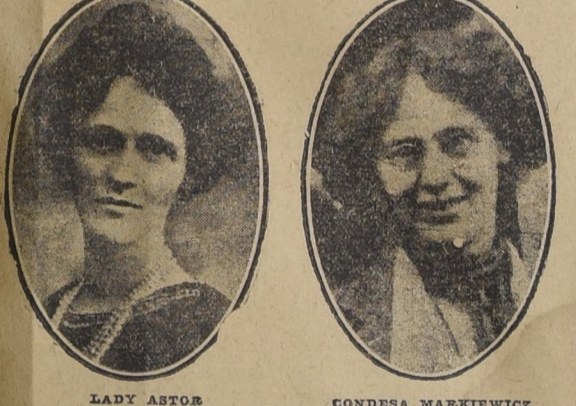
LADY ASTOR CONDESA MARKIEWICZ

Ha un año, cierto número de mujeres quiso aprovecharse de las ventajas que les daba la reforma electoral en Gran Bretaña, con el fin de presentar su candidatura a un asiento en la Cámara de los Comunes. Todas ellas fueron des-