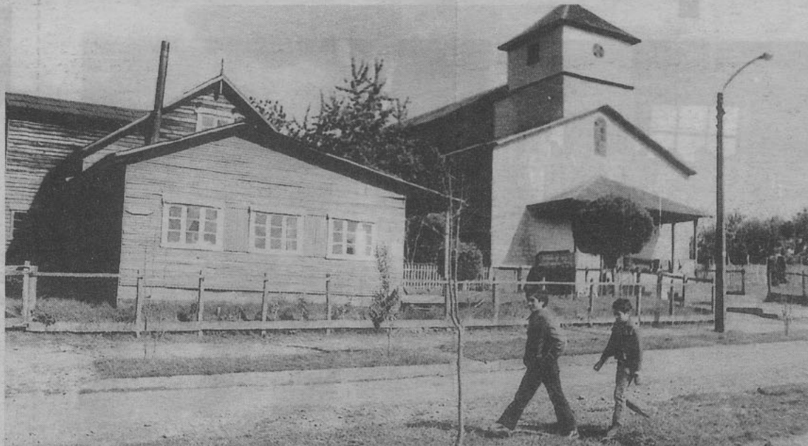
En esta foto de archivo se estampa el pasado reciente de Riachuelo. Hoy la villa luce un marcado progreso urbanístico.

La villa estuvo y permanece ubicada en medio de la ruta española Camino Real, que se extiende desde Valdivia hasta Maullín, con una población que hoy no supera las 1.500 personas. En su nacimiento se transformó en una de las más prósperas 190 comunidades creadas a fines del