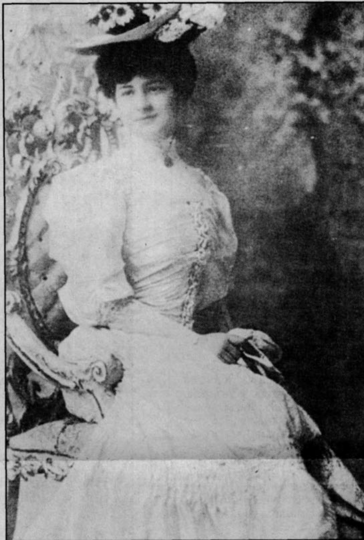
La madre del escritor Enrique Bunster, en una hermosa fotografía captada por el retratista Heffer en 1908. El escritor nació en el seno de una familia de gran fortuna y conoció desde niño las elegantes tertulias de esos años. Sin embargo, como escritor vivió una vida austera.

Al recopilar las Crónicas en azul y verde, Carmen Gaete nos ha llevado a rememorar a un escritor que mantiene su galanura y su instancia, que se enamoró por primera vez a los cincuenta años y que demostró que una mujer bailando cueca en la cubierta de un velero, puede ser más poderosa que la invencible Armada.