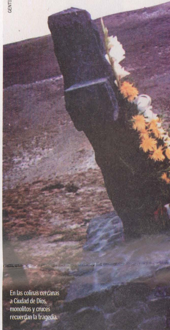
En las colinas cercanas a Ciudad de Dios, monolitos y cruces recuerdan la tragedia.