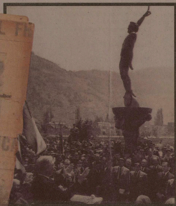
Inauguración del "Monumento a Rodó" en el antiguo Parque Gran Bretaña, hoy Balmaceda, en Providencia en 1944.