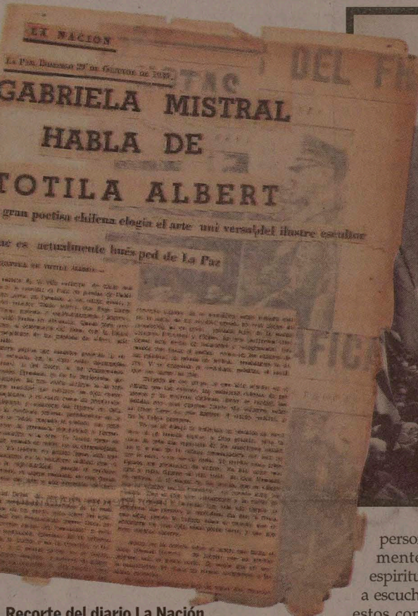
Recorte del diario La Nación de Bolivia, en que Gabriela Mistral alaba el trabajo escultórico del artista chileno.