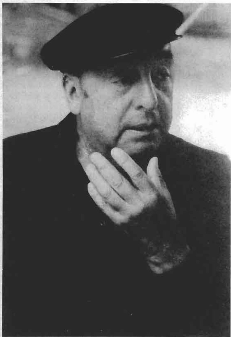
1./ Fotografia de Luis Poirot, 1969