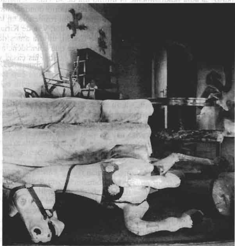
4./ La casa de Isla Negra, 1982