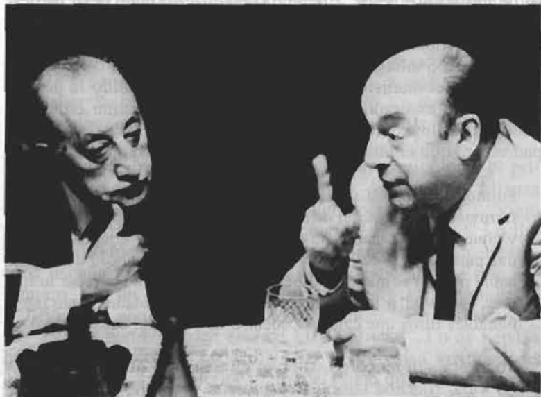
5./ Con Miguel Ángel Asturias en Budapest, 1965, mientras escribían Comiendo en Hungría

Vale decir: debía tomar en cuenta el arco iris.