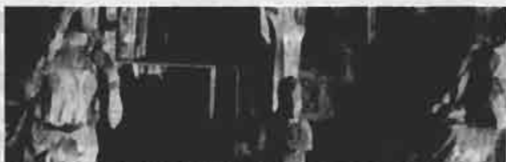
6./ Un aspecto del salón de la casa de Isla Negra