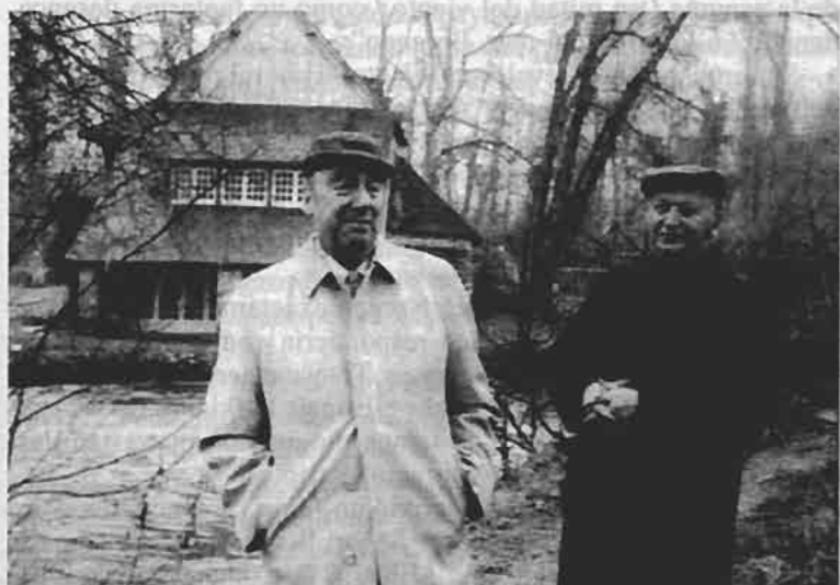
9./ Fotografía tomada por Julio Cortázar en la casa de Neruda en Normandía