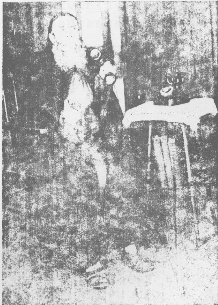
"EL CRISTO DE ELQUI"

cosa que hago hasta el día de hoy a 20 años de esa fecha fatídica.