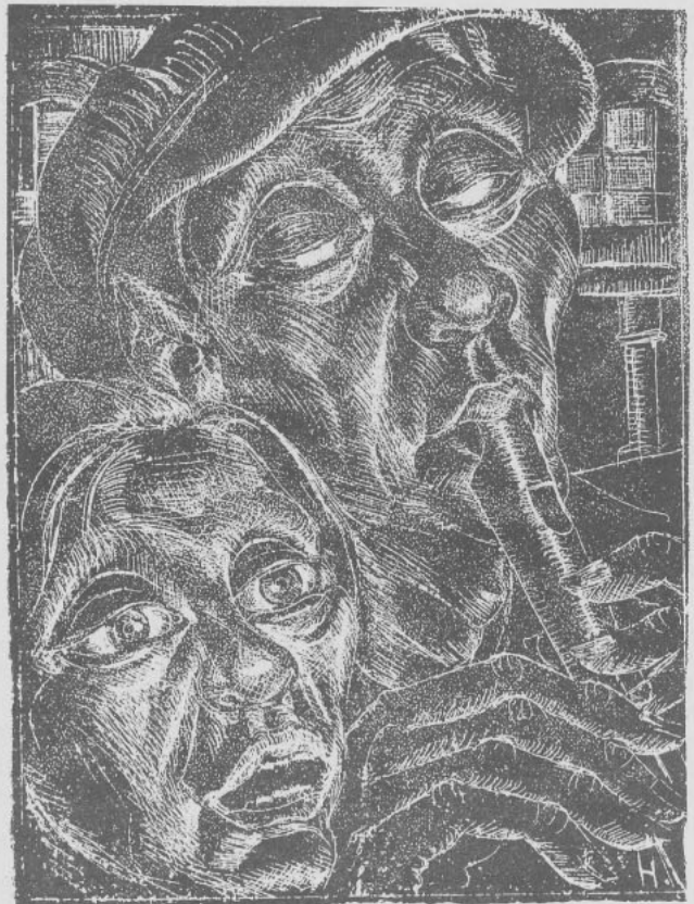
El ciego y su mujer, grabado de Carlos Hermosilla Alvarez.