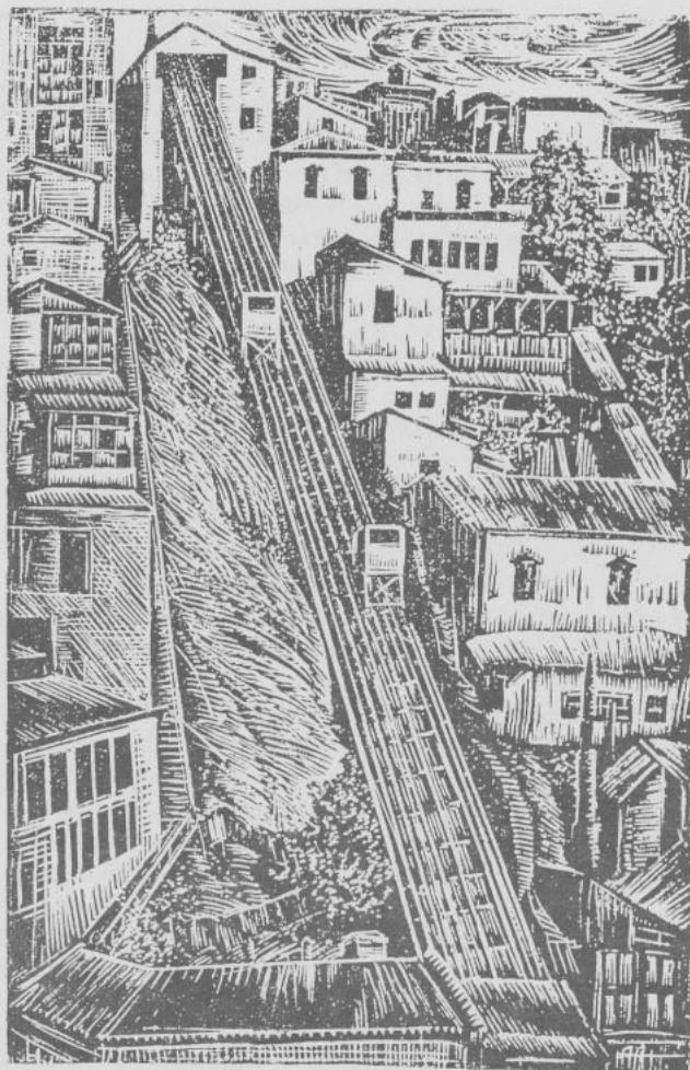
El ascensor (Valparaíso), grabado de Carlos Hermosilla Alvarez

-Ninuno. La estación queda cerca, y llamando por teléfono a la Policía, ésta se presenta aquí en dos minutos. A propósito de Policía, mañana estamos a primero, y hay que abonar las