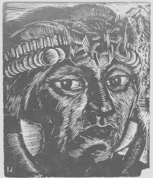
Joven mapuche, grabado de Carlos Hermosilla Alvarez.