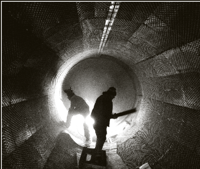
Dinámicas del vacío, obra de Ariel Bustamante y Alfredo Thiermann.

Fotografía, escultura sonora y microdocumental-ficción son los lenguajes artísticos que acercarán a los visitantes al último confín del mundo, a través de la experiencia vivida por tres jóvenes artistas, plasmada ahora en una exposición.