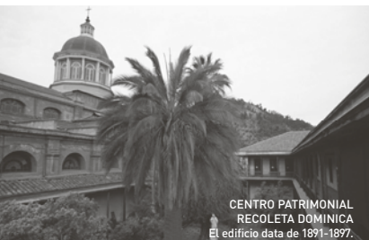
CENTRO PATRIMONIAL RECOLETA DOMINICA El edificio data de 1891-1897.