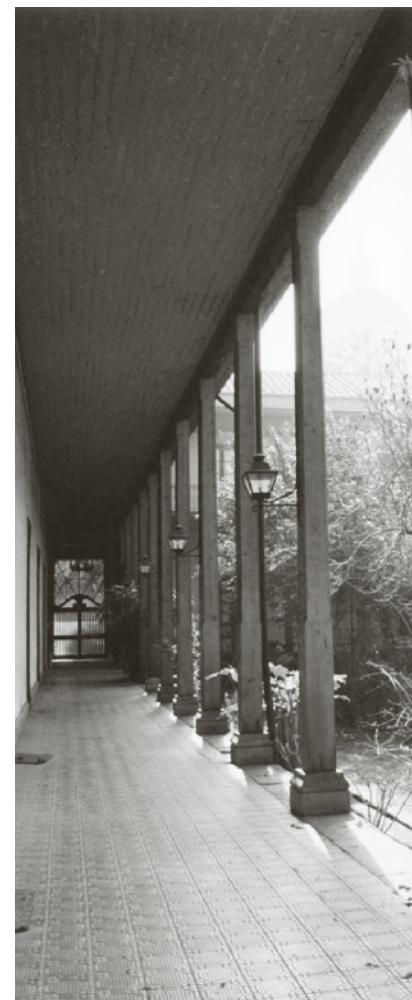
Pasillo interior en el Centro Patrimonial Recoleta Dominica.