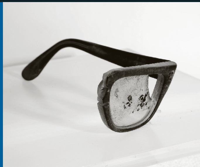
Fragmento de los lentes del Presidente Salvador Allende, encontrados en las ruinas del Palacio de La Moneda.

El miércoles 11 de septiembre, el Museo Histórico Nacional inaugura la exposición “Memoria y Registro, 11.9.73” , en el contexto de la conmemoración de los 40 años del Golpe de Estado . Esta exhibición retrata 10 testimonios de las vivencias personales de ciudadanos comunes y anónimos con respecto al episodio, a través de fotografías, textos y objetos donados por particulares. Para esto, el Museo insta a que los chilenos a que entreguen objetos que den cuenta de este periodo, los cuales se irán incorporando a la exposición y, posteriormente, a la colección permanente. Esta exhibición pretende generar una instancia de memoria colectiva en torno al hito, recordando las vivencias particulares y haciendo que los visitantes se expresen y dejen registro de sus experiencias.