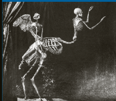
"Cupido y Centauro", 1992 [detalle].

El poeta y músico popular, guaripola de "Los Guachacas", analiza junto al público una obra de la Colección del Museo. Segundo piso, ala sur.