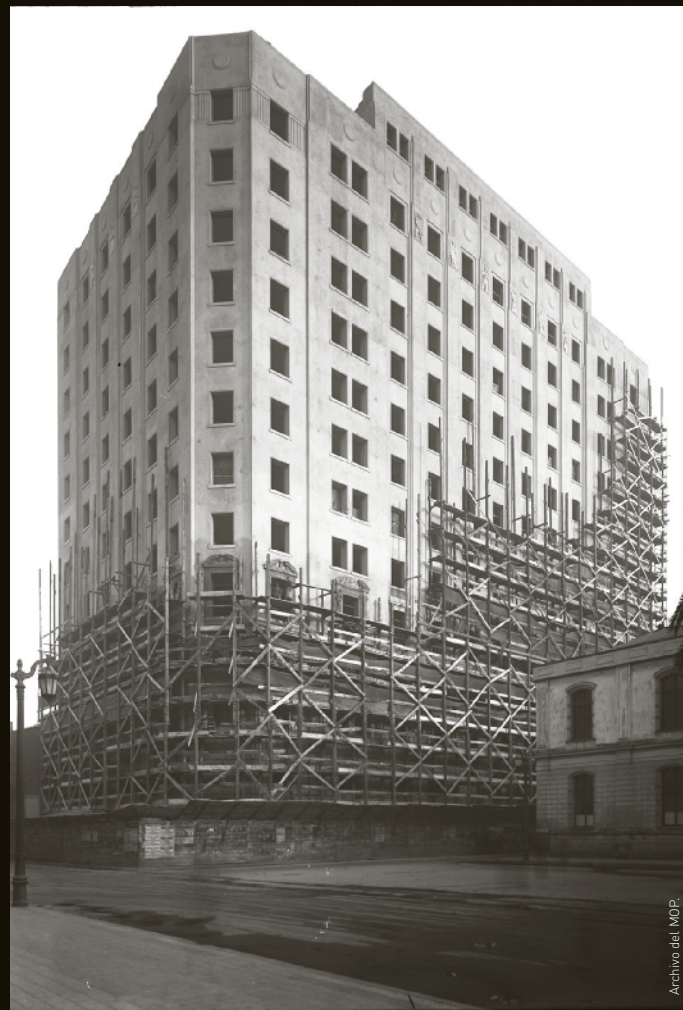
Construcción del edificio del Ministerio de Hacienda, en calle Teatinos.