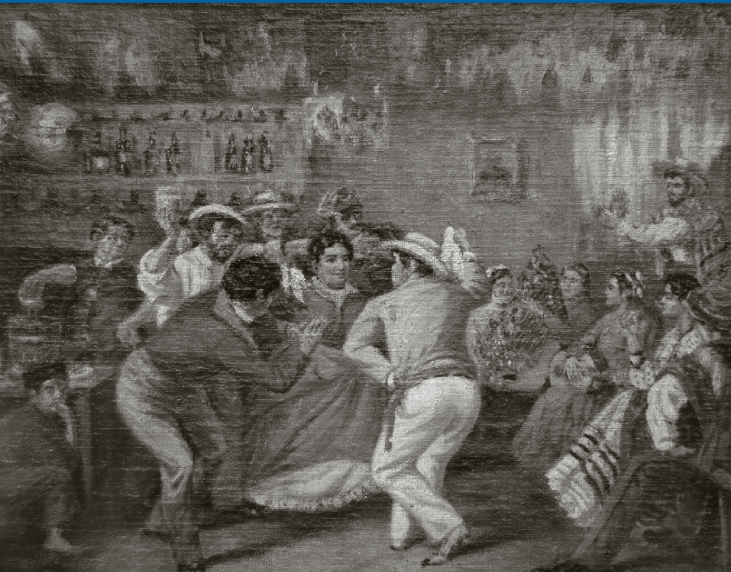
MANUEL ANTONIO CARO, Chile 1835 - 1903