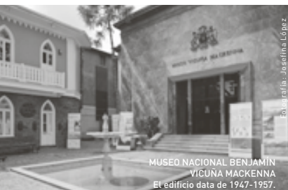
MUSEO NACIONAL BENJAMÍN VICUÑA MACKENNA El edificio data de 1947-1957.