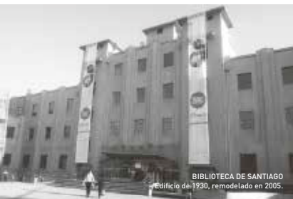
BIBLIOTECA DE SANTIAGO Edificio de 1930, remodelado en 2005.