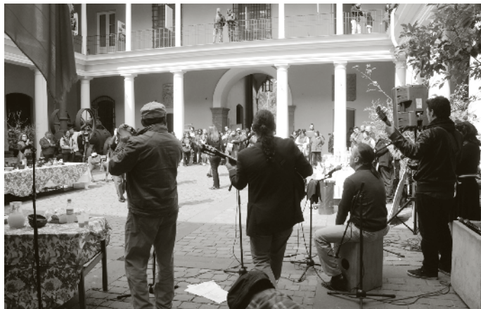
Ramada dieciochera en el Museo Histórico Nacional en 2012.

Se repite un programa destacado de la semana los domingos, de 13:00 a 14:00 hrs.