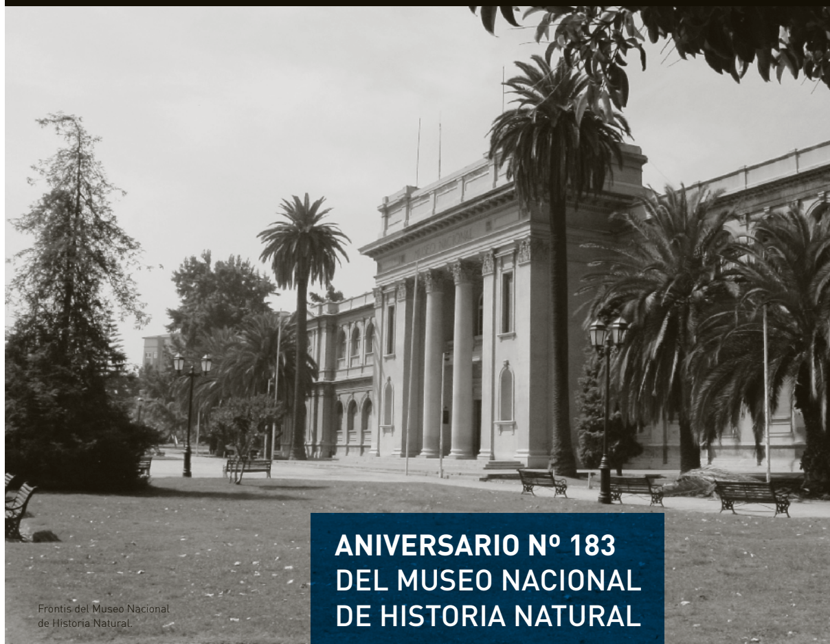
Frontis del Museo Nacional de Historia Natural.

ANIVERSARIO N° 183 DEL MUSEO NACIONAL DE HISTORIA NATURAL