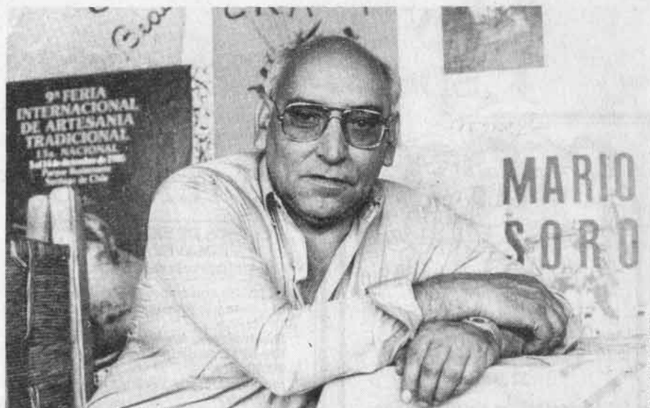
Juan Radrigán: pesimista con la alegría

Será una ocasión de reencuentro entre el dramaturgo y su público, aunque el mismo Radrigán no esté muy seguro de ello. A tres semanas de su llegada a Chile, dijo a HOY: "A riesgo de transformarme en un mercader de ilusiones, yo no puedo cambiar la tristeza por la alegría mientras