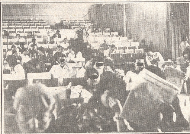
Un mundo donde todos esperan algo y donde pocos lo obtienen.

Dicen que se trabaja mejor si se está un poco nervioso antes de salir a terreno. Así como los artistas antes de subirse a un escenario. Claro que el escenario de ese viernes por la noche era uno lleno de butacas viejas, acomodadores cómplices, homosexuales lascivos y luces de neón que encandilan. Una noche en que la vida, o