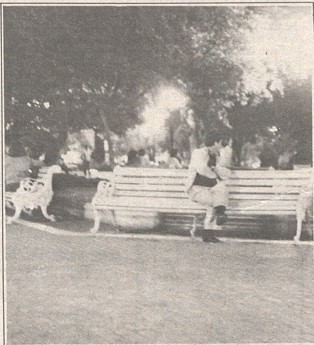
Plaza de Armas: donde los homosexuales y prostitutas hacen nata.

Empezamos a barajar otros cines, pero finalmente decidí entrar al Capri. Mal que mal, era el "antro" y pensé que sería interesante