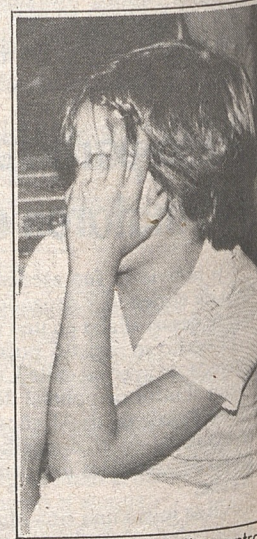
Al mundo "gay" se entra desde muy pequeño.

Me vuelvo a juntar con mis amigos. Les cuento la entrevista. Llegamos a la Plaza de Armas, donde las prostitutas y los homosexuales hacen nata. Conversamos. Y recién ahí me doy cuenta de una gran contradicción: la palabra "gay" significa literalmente "alegre" en inglés. Y este mundo que recién vi no tiene nada de alegre, no tiene nada de entretenido, no es tan «gay» como se cree.