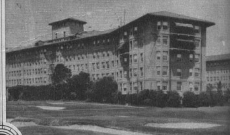
Abajo: Una de las alas de apartamentos del HOTEL AMBASSADOR , considerado uno de los más grandes del mundo.