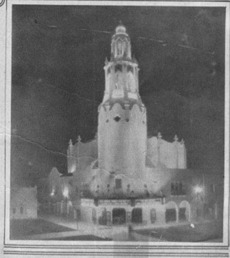
La extraña silueta del Teatro CARTHAY CIRCLE y de su torre española, típicamente iluminada como un faro de actividad en la negrura de la noche.

De San Pedro es posible venir a Los Angeles en magníficos coches salones o en automóvil. Y nos encontramos, una hora después, en el corazón de la ciudad, en la calle Broadway, plena de rascacielos, con una verdadera erga de grandes aviones, anuncios teatrales, etc., y una actividad de tránsito que es famosa en los Estados Unidos. Al fondo de la calle Broadway