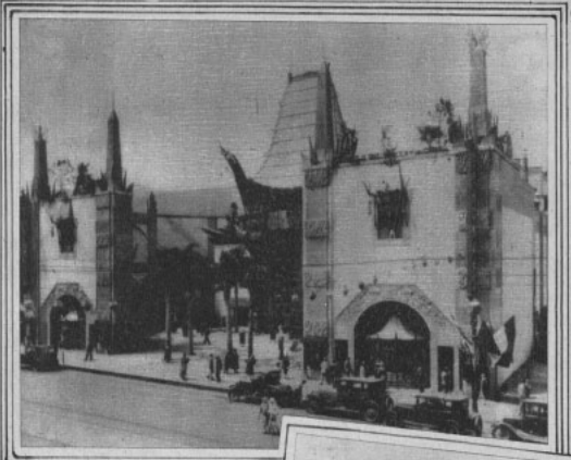
La mole inmensa del TEATRO CHINO , el punto de cita de los turistas del mundo entero, que visitan la ciudad de las estrellas.

se destaca la immaculada blancura de la torre monstruo del City Hall. Pero nada de esto nos interesa; queremos ir a Hollywood. Y tomamos en nuestro coche el Boulevard Wilshire, magnífica avenida de más de treinta metros de ancho, a tal punto que se forman cuatro filas de automóviles a cada lado. Wilshire es considerada la arteria más larga del mundo; partiendo de Los Angeles cruza todo Hollywood y llega hasta las playas de Santa Mónica, con una extensión total de treinta millas.