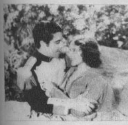
Una escena de «ESPADAS Y CORAZONES»

Leading-lady de Novarro, es la hermosa actriz, discreta y con apreciables facultades artísticas, Dorothy Jordan. Los demás personajes de la obra, bastante numerosos, están a cargo de buenos actores que secundan con acierto a los protagonistas.