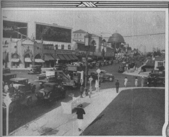
Una de las esquinas de los BOULEVARES HOLLYWOODENSES , a la hora de tránsito intenso.

su parte: el palacio del teatro Follies, que se inaugurará en pocos días más; luego los teatros luminosos, monstruos de los estudios Universal, colocados tan estratégicamente que Mr. Laemmle paga con todo gusto dos mil dólares mensuales por derecho al sitio. Frente a ellos hay dos grandes rascacielos destinados a oficinas, con tiendas de lujo en sus pisos principales. Y siguen los grandes edificios, el café de Henry, con su entrada de estilo inglés, donde cada noche se reúne una muchedumbre de gente de cine, antes y después del teatro, y donde se pueden ver concurridos con alguna similitud a Charlie Chaplin. Luego destaca su mole, a la vuelta de la calle Dwar, el «Nickerbocker», uno de los apartamentos de lujo que no son precisamente un hotel, y en cuyos comedones a la hora del té es posible charlar con las famosas estrellas que viven allí. Más adelante está la Biblioteca Pública de Hollywood, los edificios albos de sus grandes teatros, el Teatro de Warner Brothers, decorado luz y color, e infinidad de otros teatros de menor importancia, muchas veces en una soledad de gente en las veredas espaldado sitio para entrar.