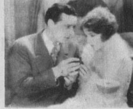
Una escena de «LOS PARIENTES DE LA ESPOSA»

Esta obra, estrenada en la Sala Imperio, tiene como protagonista a Pola Negri, la celebrada actriz polaca. Y puede decirse con propiedad, que ella sola llena la escena con su personalidad. La Fedora de esta artista, con las características espirituales de que la dotó Sardou, impresiona fuertemente en el ánimo del espectador, en el doble papel de vengadora de la muerte de su prometido y de amante del asesino. Es esta una de las mejores caracterizaciones que conocemos de Pola Negri. Su leading-man, Norman Kerry, hace una excelente interpretación de su personaje, pero al lado de ella aparece en relativa inferioridad.