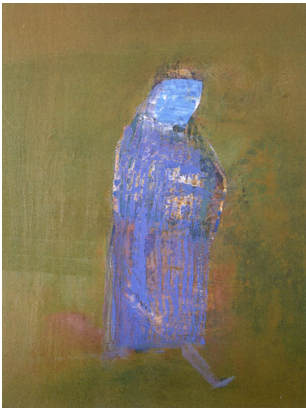
HEDGEHOG V ON HOLLIDAY III