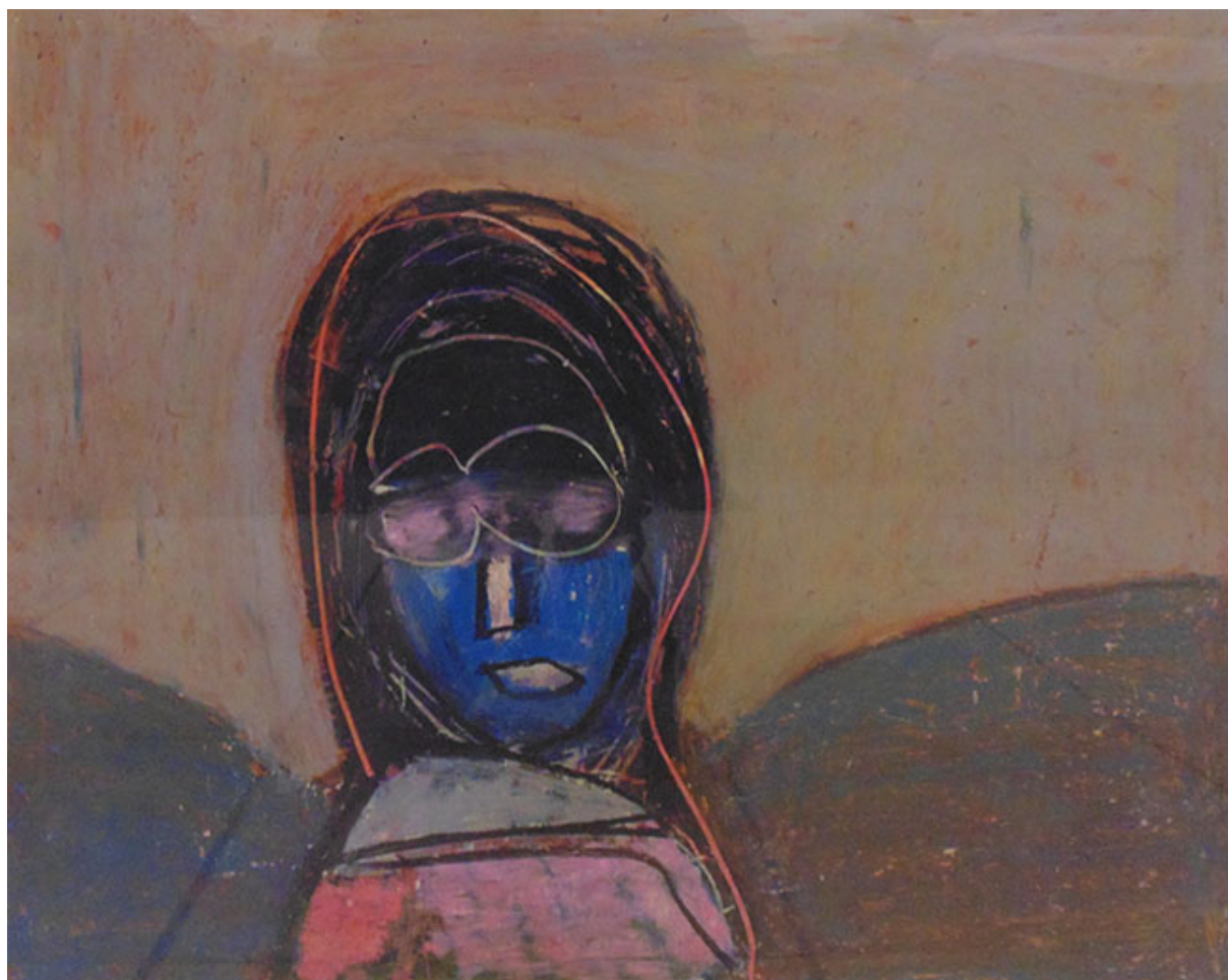
MUJER CON ANTEOJOS

UNIVERSIDAD CATÓLICA DE VALPARAÍSO TELEVISIÓN, UCV Televisión. Demoliendo el Muro [Videgrabación]. Conducción Milan Ivelic y Gaspar Galaz. 1983. DVD V. 8. (Disponible en Sala de Lectura de la Biblioteca MNBA)