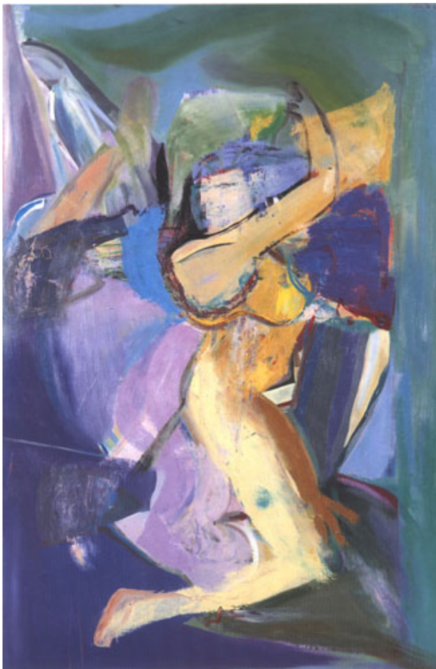
LA VENUS AZUL