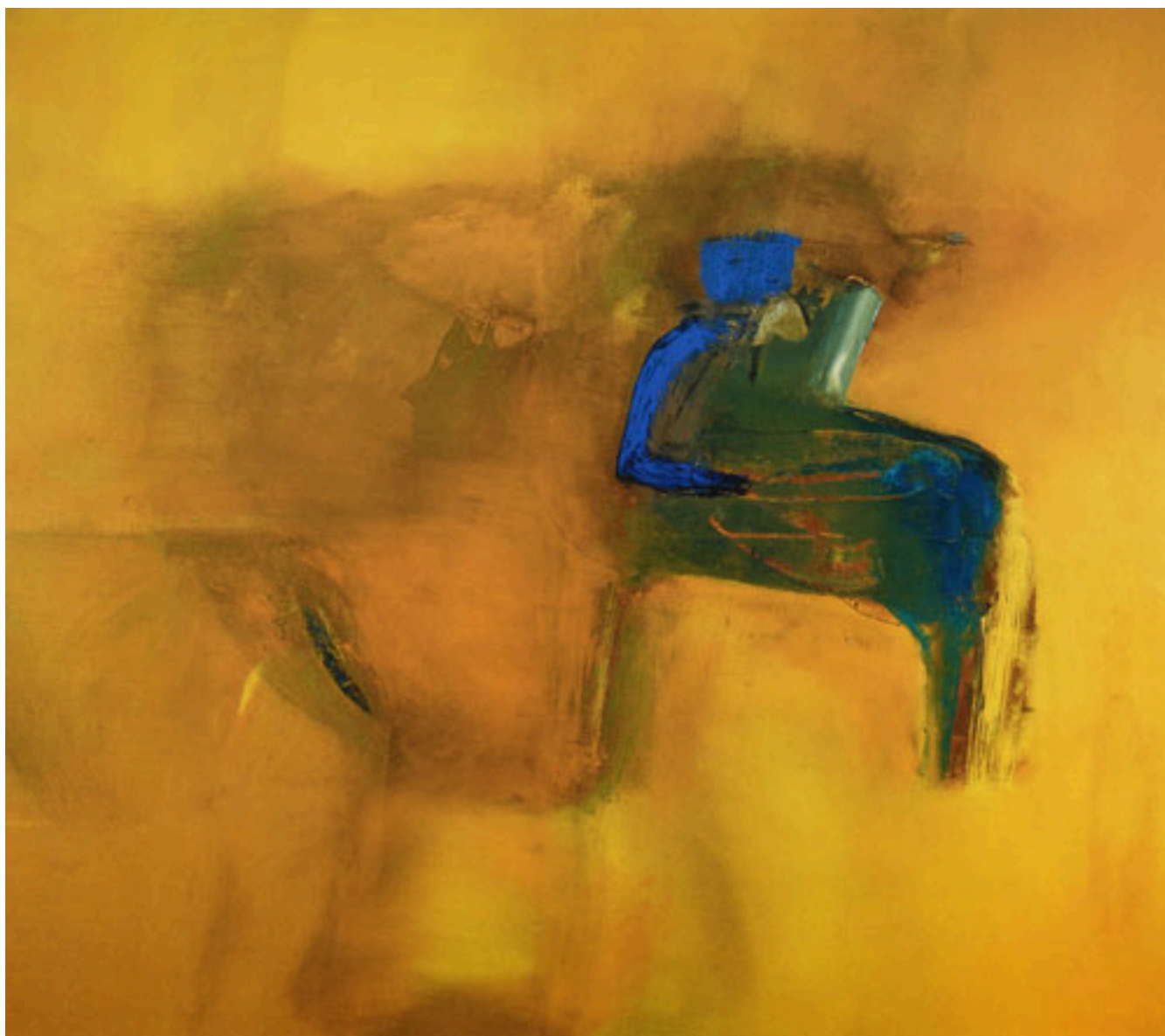
HEDGEHOG V ON HOLLIDAY X