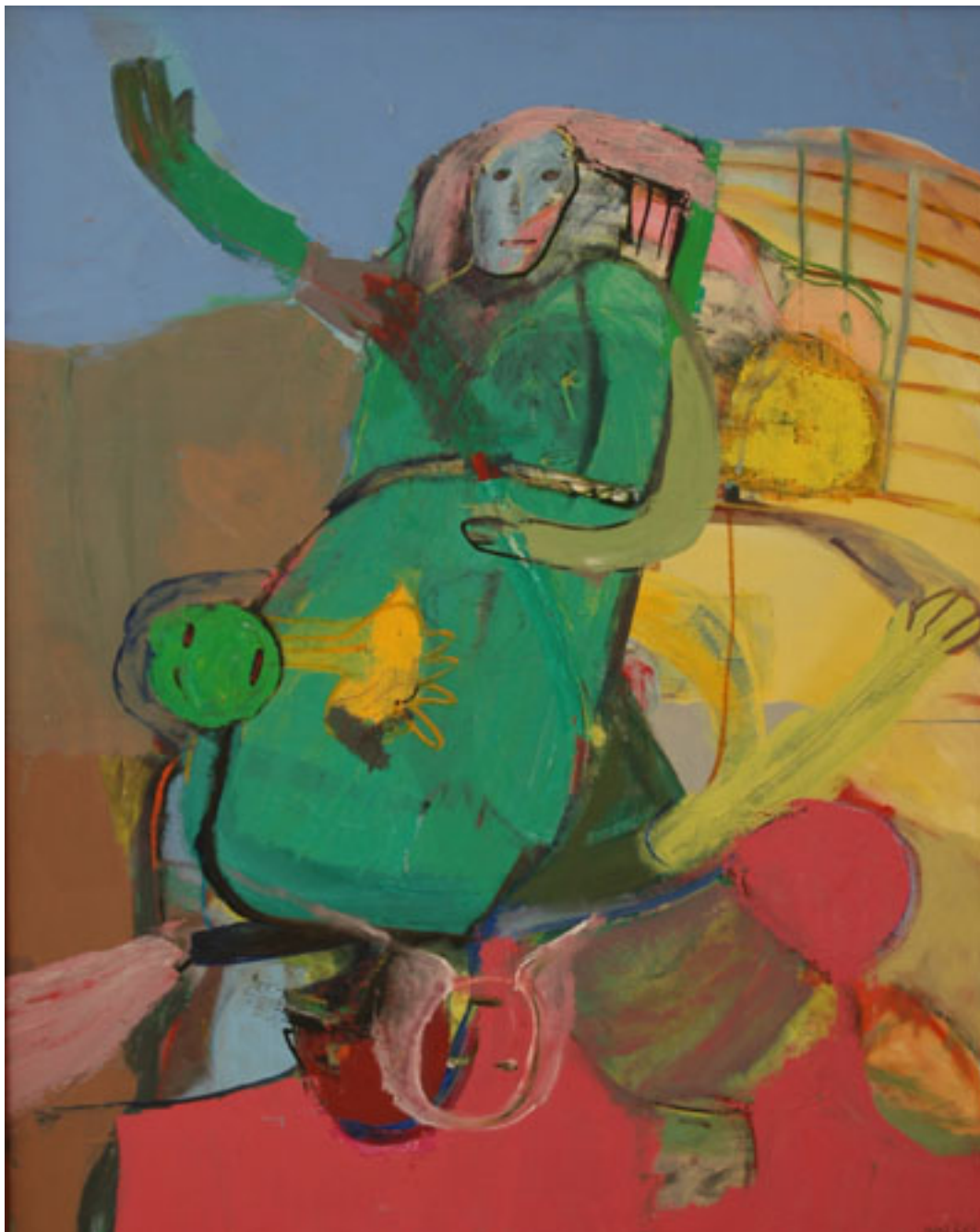
LA DIOSA DE LA FERTILIDAD