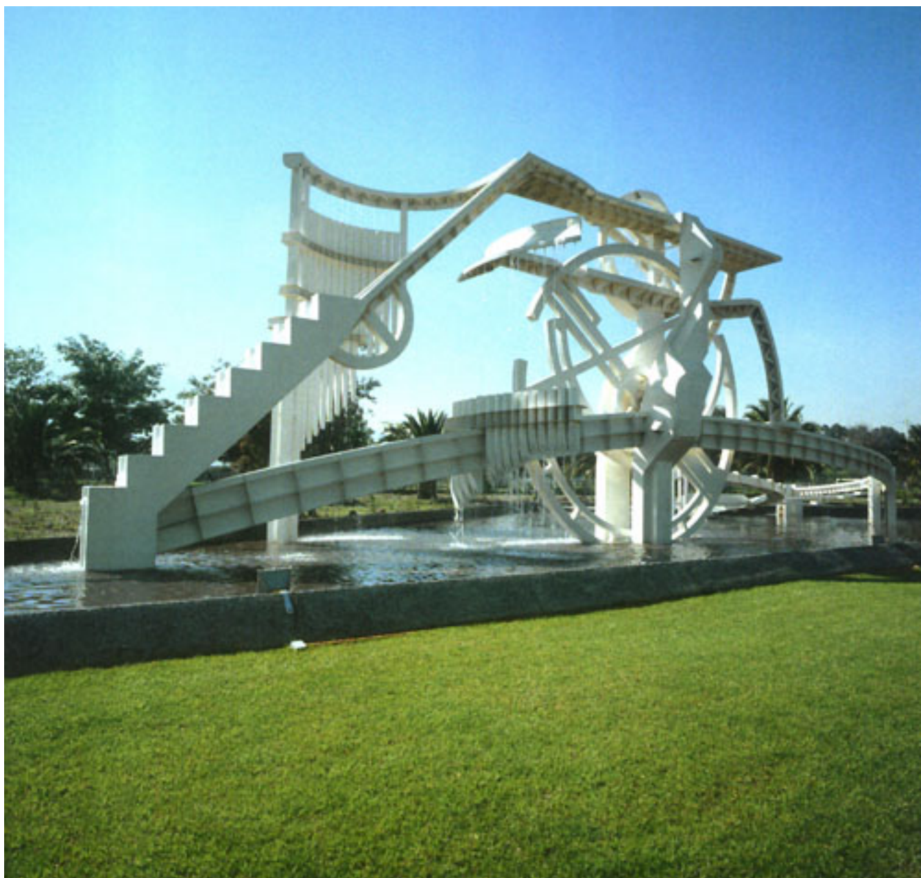
RUEDA DE LAMAHUE