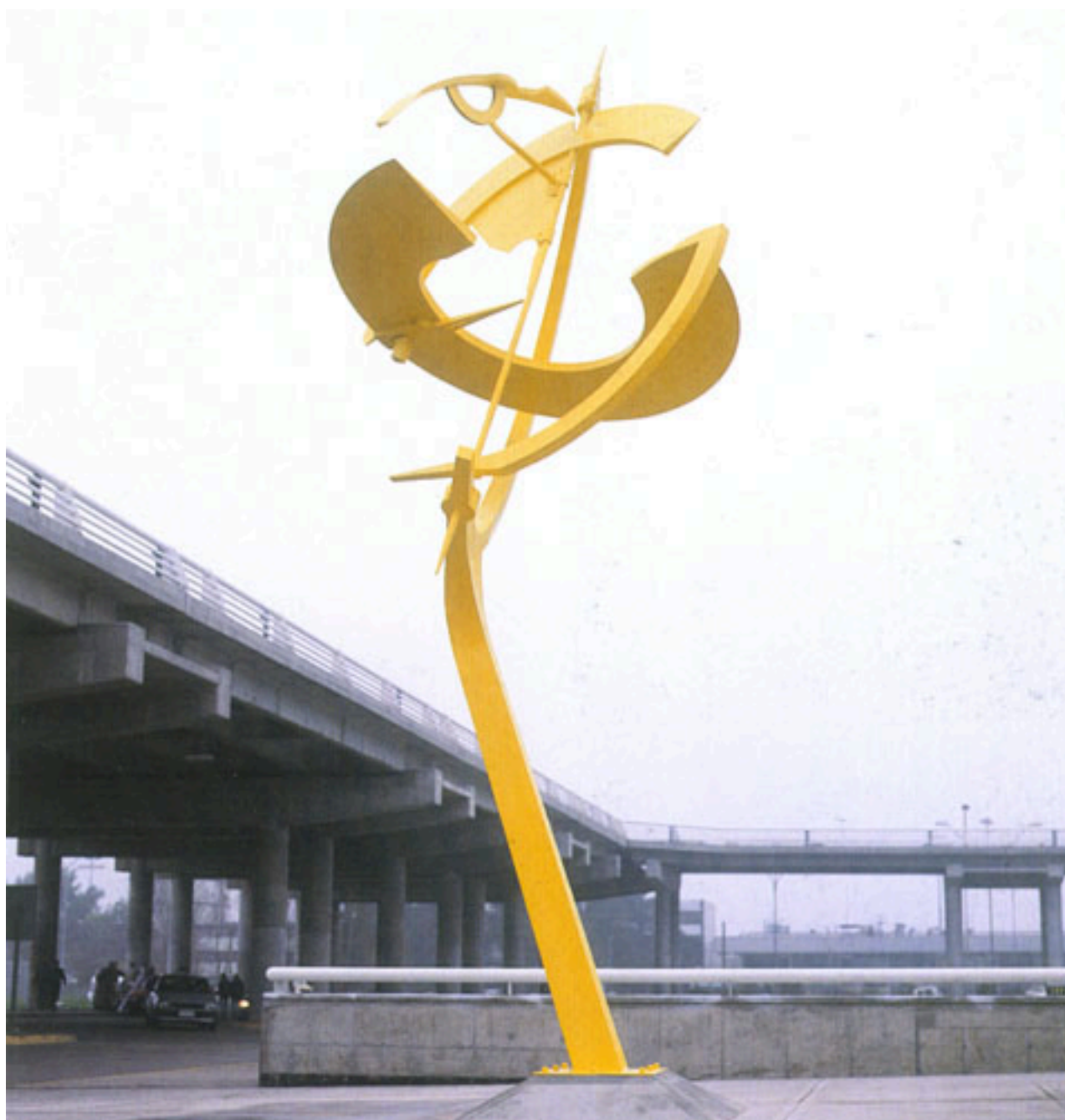
TERCER MILENIO ESCULTURA