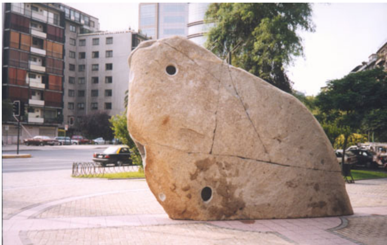
CORDILLERA DE LOS ANDES