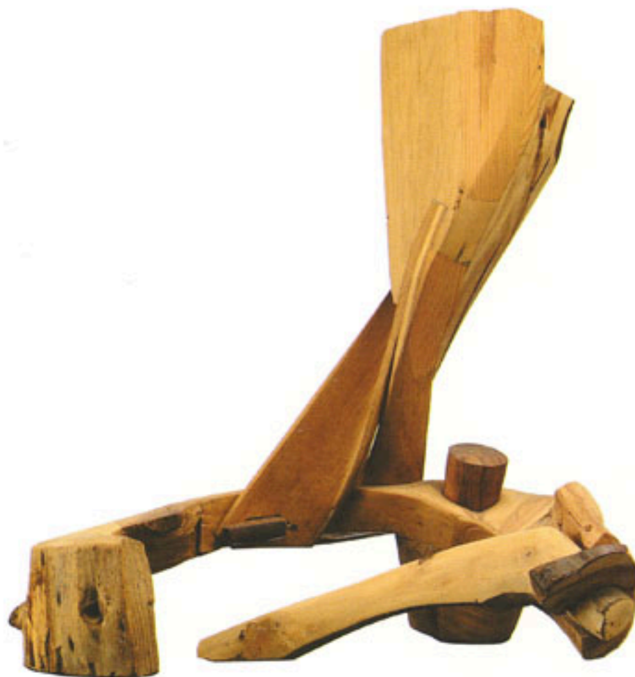
FIGURA HUMANA SENTADA