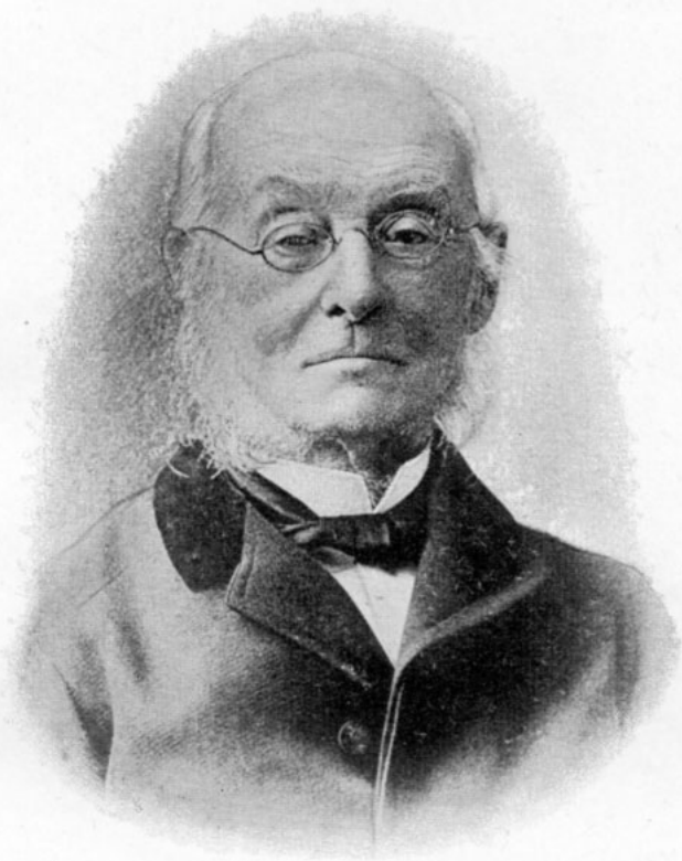
DR. R. A. PHILIPPI